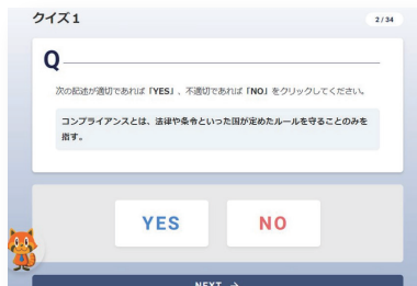
- 教材内画面イメージ -

Q&A形式の教材で取り組みやすい構成です。さらに最後の確認テストは全問正解することを学習修了の要件として設定しているため、理解度の確認と知識の定着が見込めます。